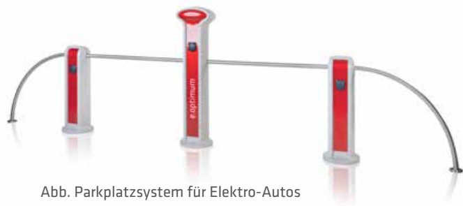
Abb. Parkplatzsystem für Elektro-Autos

Ideal für größere Parkplätze mit vielen Besuchern, z.B. vor Einkaufszentren oder an beliebten Ausflugszielen.